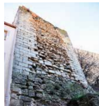
Torre de l'antic castell.