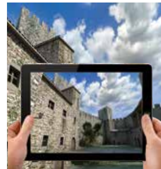
Amb la realitat virtual descobrirem com era el castell en el segle XIV.