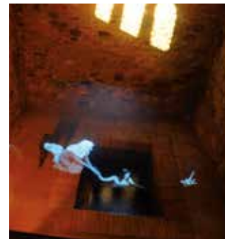
Holograma d'un micvè jueu amb banys de purificació.