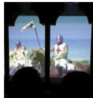
Audiovisual que explica qui eren els cavallers templers i els hospitalers