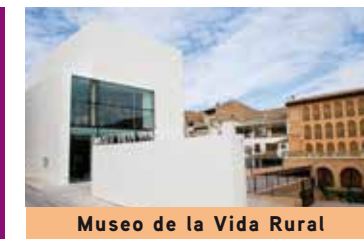
Museo de la Vida Rural