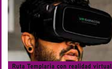
Ruta Templaria con realidad virtual